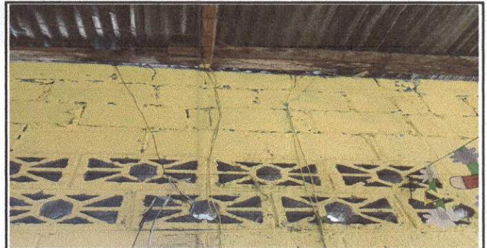
sustitución del sistema electrico Modulo de aulas y modulo de corredor

Observación: Si es necesario se pueden agregar hojas adicionales y actualizar el registro de las fotos.