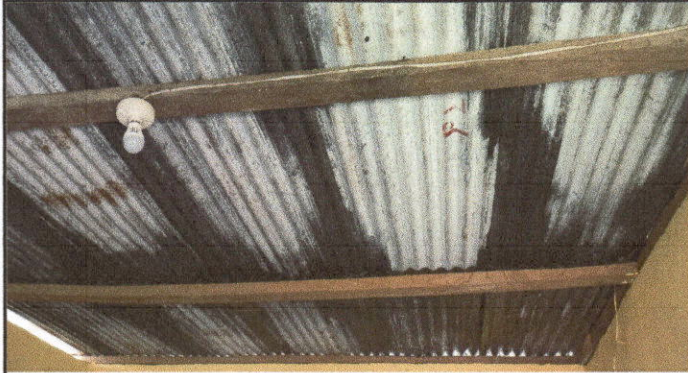
sustitución de lamina, por lamina troquelada aluzinc, y sustitución de madera por metal modulo 1 direccion