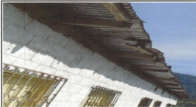
sustitución de lamina, por lamina troquelada aluzinc, y sustitución de madera por metal modulo 2 aulas