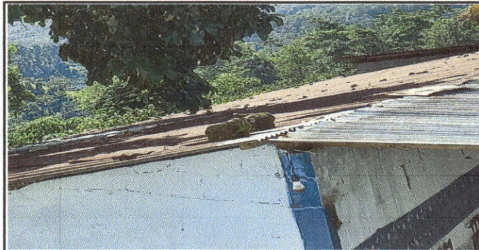
sustitución de lamina, por lamina troquelada aluzinc, y sustitución de madera por metal, sustitución de capote de lamina para lamina troquelada modulo de aulas y corredor